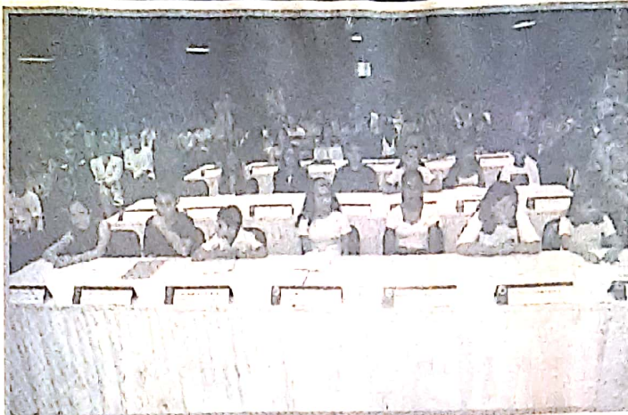
JOVENS POLÍTICOS Vereadores mirins na mesa diretora da Câmara Jovem, em São José; 20 estudantes foram eleitos em suas escolas para cumprir mandato de um ano