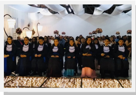
Alunos do 9º na solenidade de colação de grau.