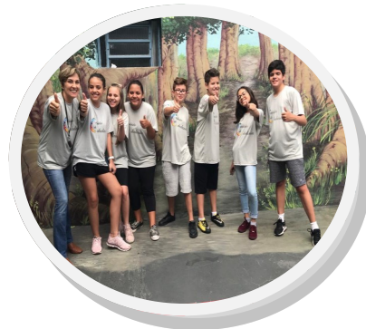
Na primeira foto a Comissão de Ética, e na segunda, a Comissão de Cidadania..